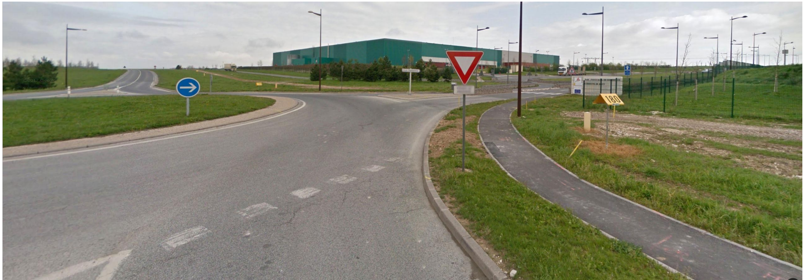
photo nov. 2010